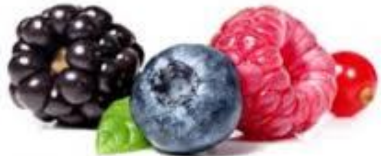
FRUITS DES BOIS fruits des bois