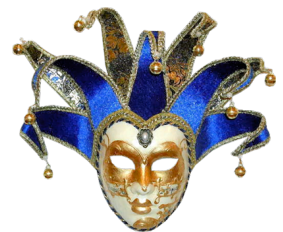
masque de carnaval