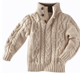
pull en laine