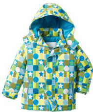
manteau de ski