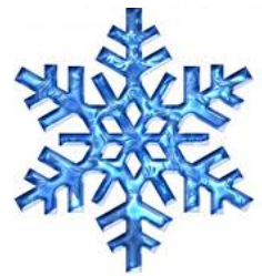
flocon de neige