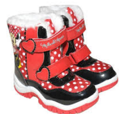
bottes de neige