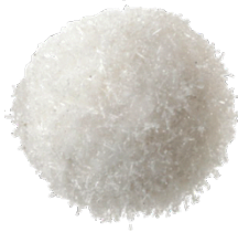
boule de neige