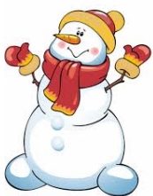
bonhomme de neige