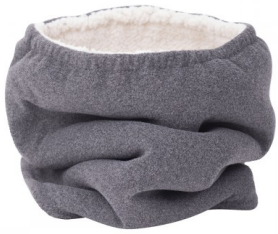
tour de cou