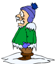
J'ai froid !