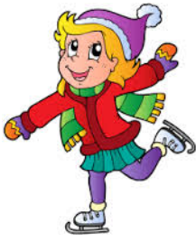
patin à glace