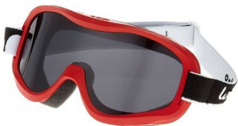
masque de ski