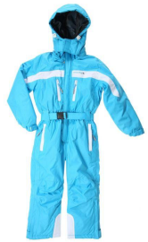
combinaison de ski