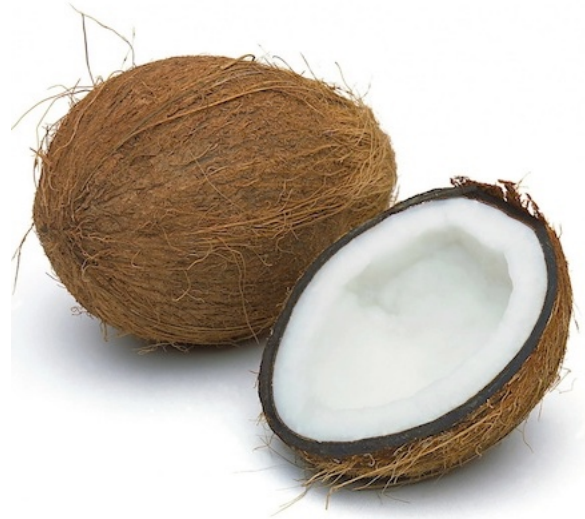
NOIX DE COCO noix de coco