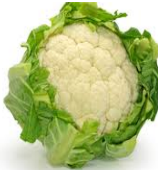
CHOU FLEUR chou fleur