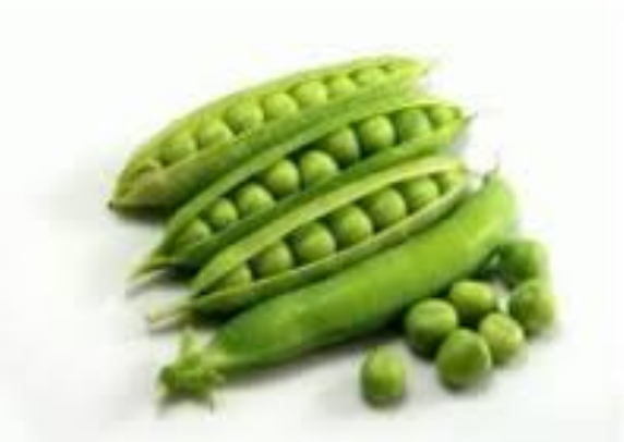
PETIT POIS petit pois